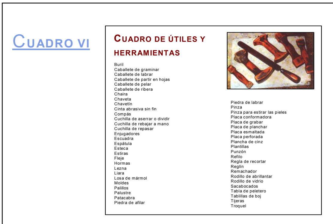
Figura 1. Cuadro de útiles y herramientas